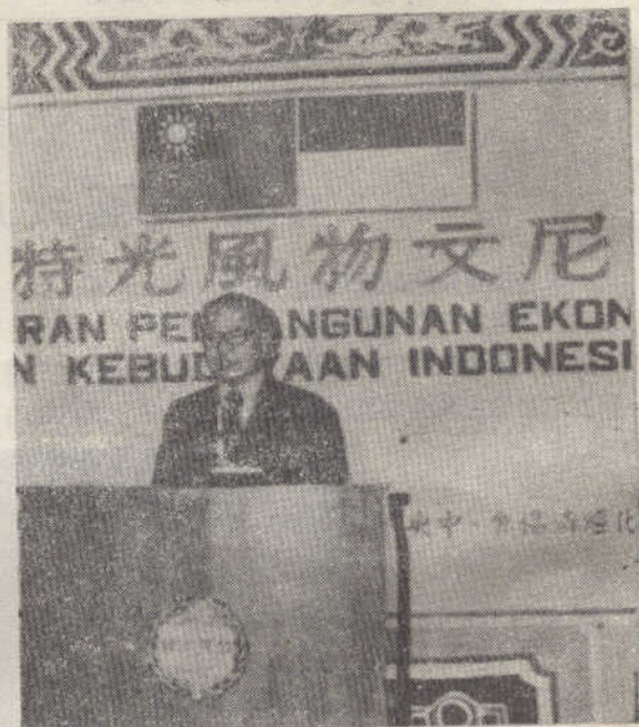
教育部朱部長在印尼文物風光特展致詞

這次展出計有珍本圖書，名貴油畫，佛蹟圖片，風光文物照片，「緊迫叮人」劇照，旅遊海報，民俗工藝品如巴厘島木雕，天堂鳥，臘染等實物。展覽期間，還特別安排放映「印尼風光」、「現代印尼」、「印尼風俗」三部影片，供參觀人士欣賞。此項展覽歷時九天，每日參觀人數均在二千人以上。